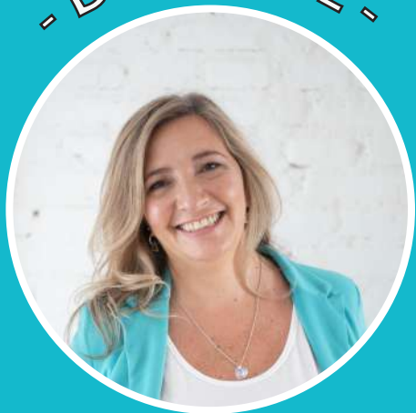
Ana Paula Fasano